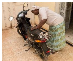
Elle se déplace à moto