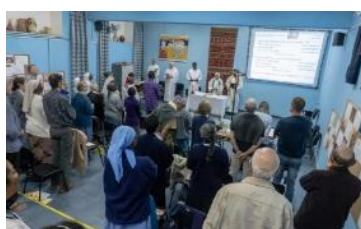
Ils célèbrent en assemblée