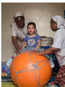
Elles donnent du soin