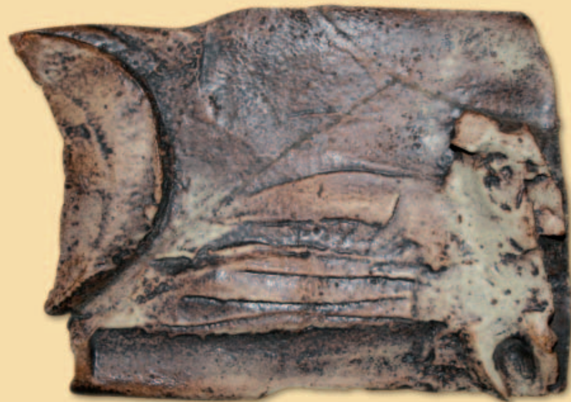
13.- LA NOCHE DEL DESIERTO

Pasa largos momentos leyendo y meditando el Evangelio, donde encuentra las palabras y los ejemplos de Jesús a quien quiere imitar. También ante el Santísimo Sacramento, donde su fe le dice que Jesús está presente con toda su fuerza salvadora para el mundo.