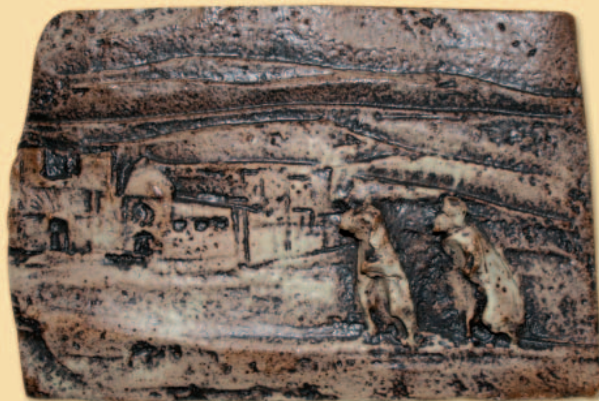
1.- VIAJE A MARRUECOS CON EL JUDÍO MARDOQUEO

En 1882, presenta su dimisión al Ejército y emprende el año siguiente un viaje de exploración a Marruecos. El éxito de esta arriesgada expedición que realiza durante once meses, disfrazado de rabino y sumergido en el mundo musulmán, le vale honores y consideración, y le abre las puertas del mundo de los geógrafos y exploradores.