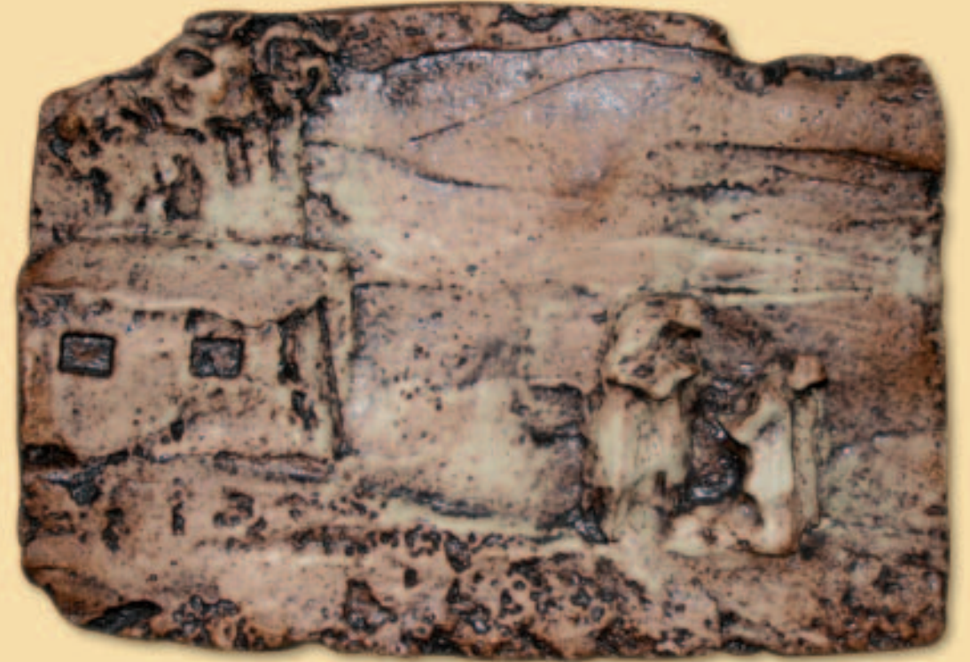
18.- ASESINATO DE CARLOS DE FOUCAULD

«Nuestro anonadamiento es el más poderoso medio que tenemos para unirnos con Jesús y hacer bien a las almas».