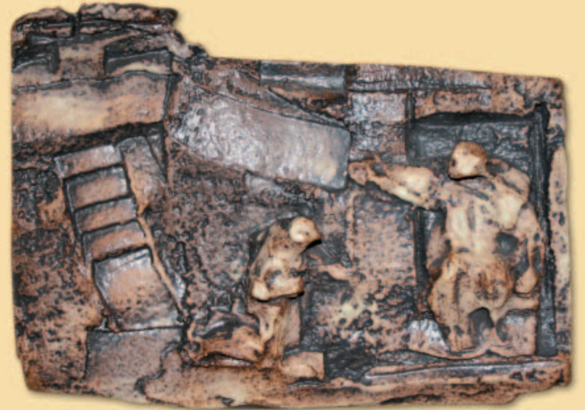
3.- «VETE A COMULGAR»