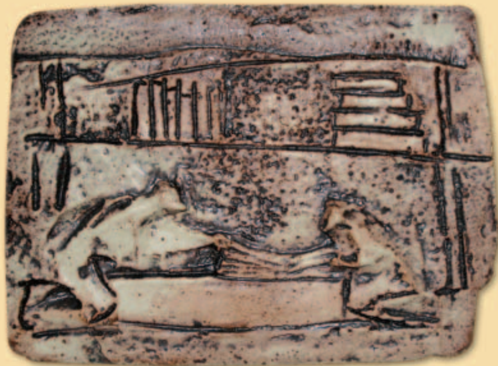
12.- TRADUCE EL EVANGELIO AL ÁRABE Y AL TARGUI

Carlos quiere ver a Jesús en todo ser humano... Este deseo le conduce a actitudes concretas: quiere “llegar a ser del país”, hablando con los Tuareg en su lengua, compartiendo su estilo de vida y sus costumbres, deseando que progresen en bienestar material y moral... «teniendo para con todos bondad y afecto fraternal, sirviéndoles en todo lo posible, entrando en contacto afectuoso, siendo un tierno hermano para todos...».