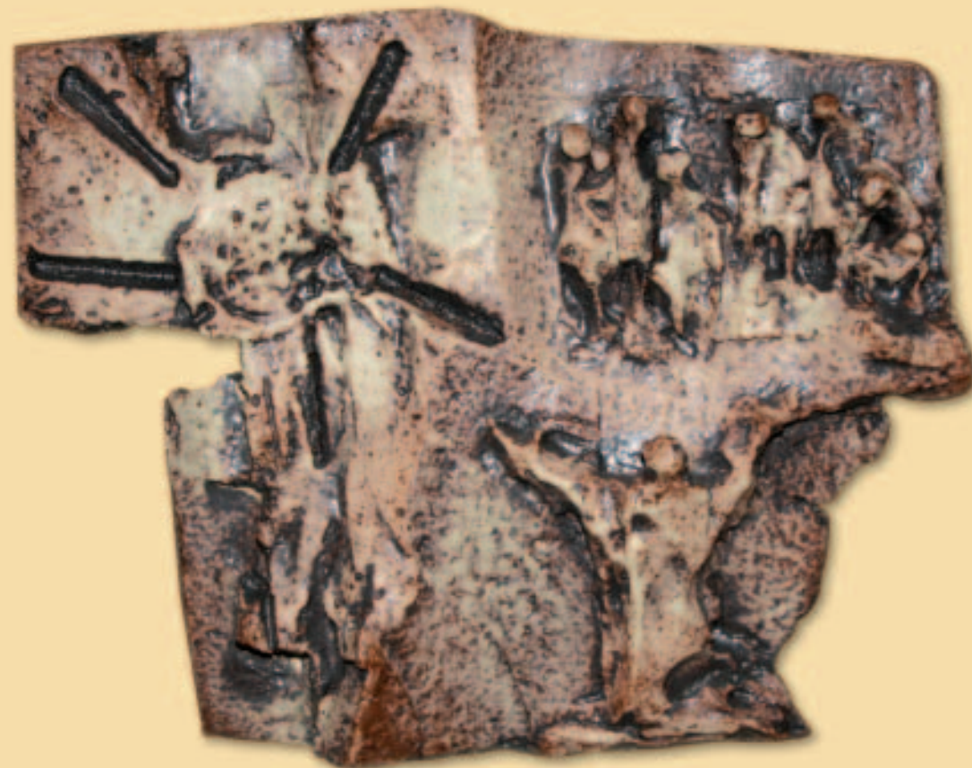
15.- LA EUCARISTÍA Y LOS POBRES

Si adora a Jesús presente en la Eucaristía, lo contempla también en los pobres con los que Dios en Jesús de Nazaret se identifica. Se pone fraternalmente al servicio de estos «pequeños» de los que habla Jesús.