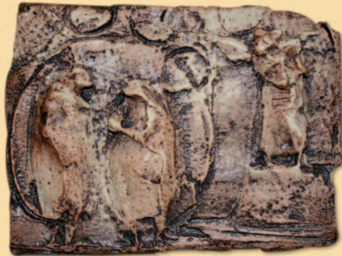
8.- LA VISITACIÓN

El pasaje del Evangelio al cual él vuelve a menudo es el de la Visitación. Le gusta contemplar esta escena: María, en cuanto ha recibido a Jesús en ella, va a llevarlo a casa de su prima Isabel, y Jesús, aún en el seno de su madre, bendice a Juan Bautista antes de su nacimiento.