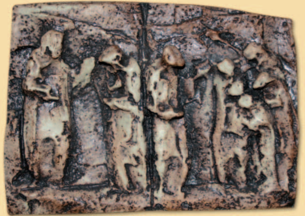
10.- LA AMISTAD

Carlos de Foucauld no busca el resultado inmediato de la conversión de los tuaregs, dejando a Dios el hecho de la conversión a la fe cristiana, quizá al paso de los “siglos”, dice. Desea finalmente que muchos cristianos del mundo anuncien el Evangelio de esta manera, cercana y discreta, «teniendo con todos bondad y afecto fraternal, haciendo todos los servicios posibles, incorporando un contacto afectuoso, siendo un hermano tierno para todos...» .