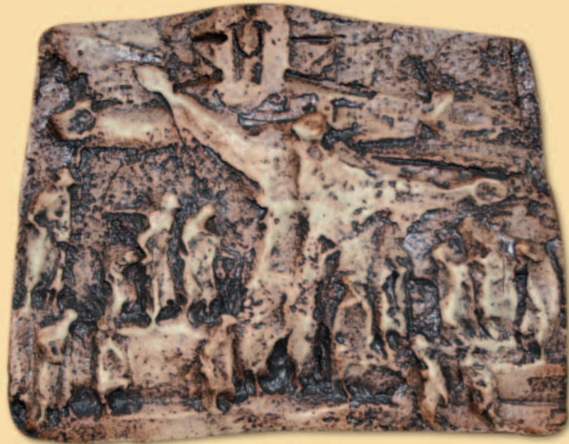
14.- EL HERMANO UNIVERSAL

Imagina una red fraternal de todos los bautizados: sacerdotes, religiosos, religiosas, laicos, que serían voluntarios de una vida sencilla según el Evangelio, y para hacerse cargo de los “más abandonados”. Anhela para todos un corazón de «hermano universal», como Jesús.