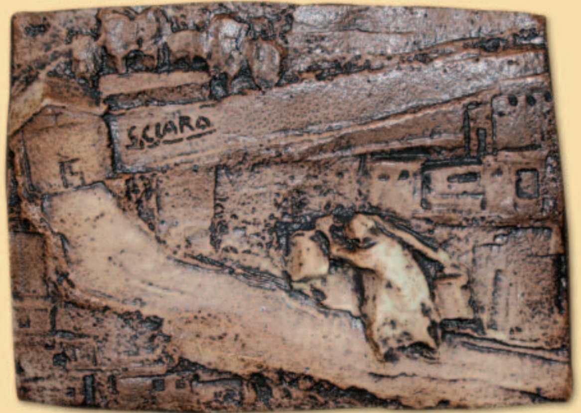
7.- CRIADO DE LAS CLARISAS

En 1897 se encuentra en Nazaret haciendo de criado de las clarisas. Allí descubre cual fue la vida humilde y oculta de Dios encarnado en la persona de Jesús, obrero pobre en Nazaret.