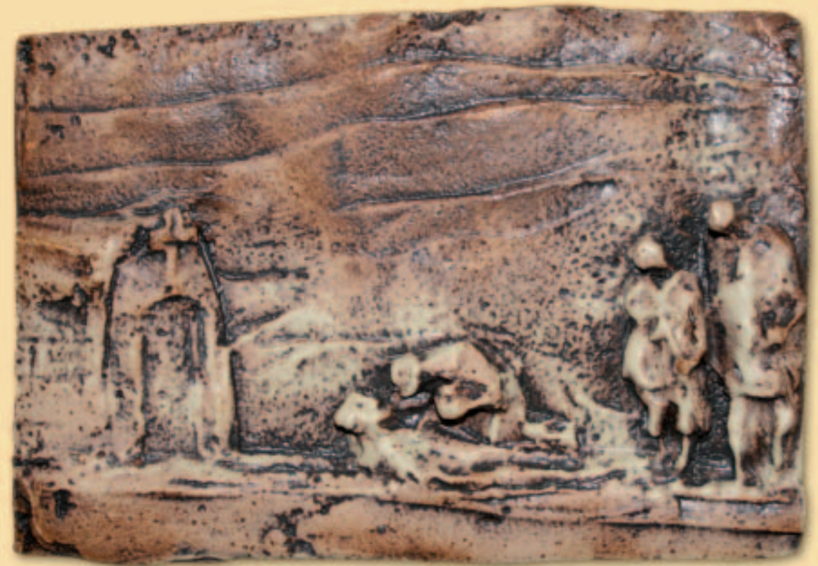
16.- ENFERMO, LE CUIDAN LOS TUAREG

En el invierno de 1907-1908 gravemente enfermo es salvado por los cuidados de sus vecinos tuareg, que van reuniendo la poca leche de las cabras para poder alimentarlo. El Hermano universal queda transformado en hermano particular. No tanto el que da, sabe y reparte bienes y sabiduría sino el que ha de aceptar los dones de los otros, pobres pero indispensables.