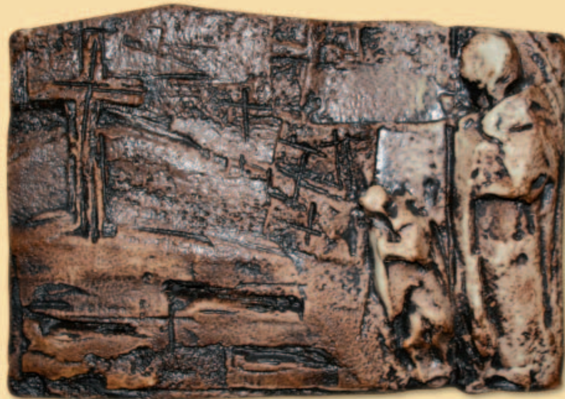
17.- «SI EL GRANO DE TRIGO NO MUERE...»

A su muerte, Carlos de Foucauld está solo... o casi. En Francia, son 49 los inscritos en la Unión de hermanos y hermanas del Sagrado Corazón de Jesús, que consiguió fuese aprobada por las autoridades religiosas. En 2005 hay 20 grupos distintos, de laicos, sacerdotes, religiosos o religiosas que viven el Evangelio por todo el mundo siguiendo las intuiciones de Carlos de Foucauld.