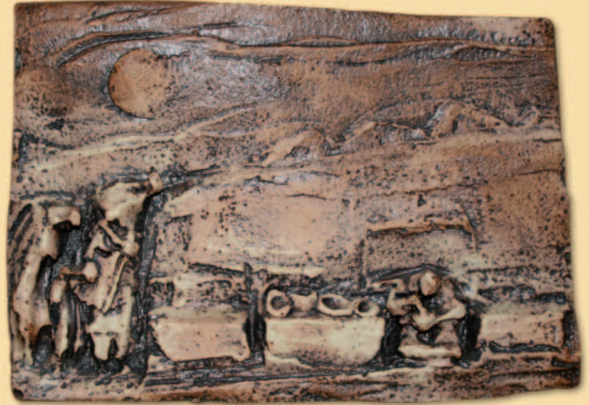
11.- QUIERE VIVIR ENTRE LOS TUAREG ORANDO Y HACIENDO ESCUDILLAS

Con estas disposiciones interiores, uno no se asombra de su atracción por la vida de Nazaret: en ella Jesús se había señalado por la consideración, total y lúcida, de lo ordinario, lo diario, lo humano, lo real.