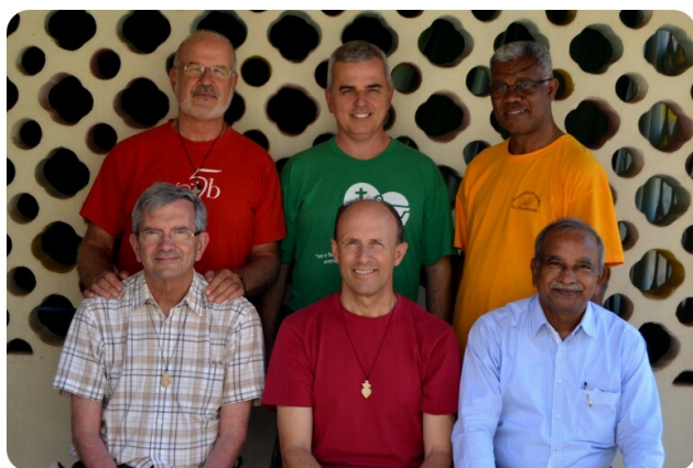
Mahajanga, Madagascar, setiembre 2014