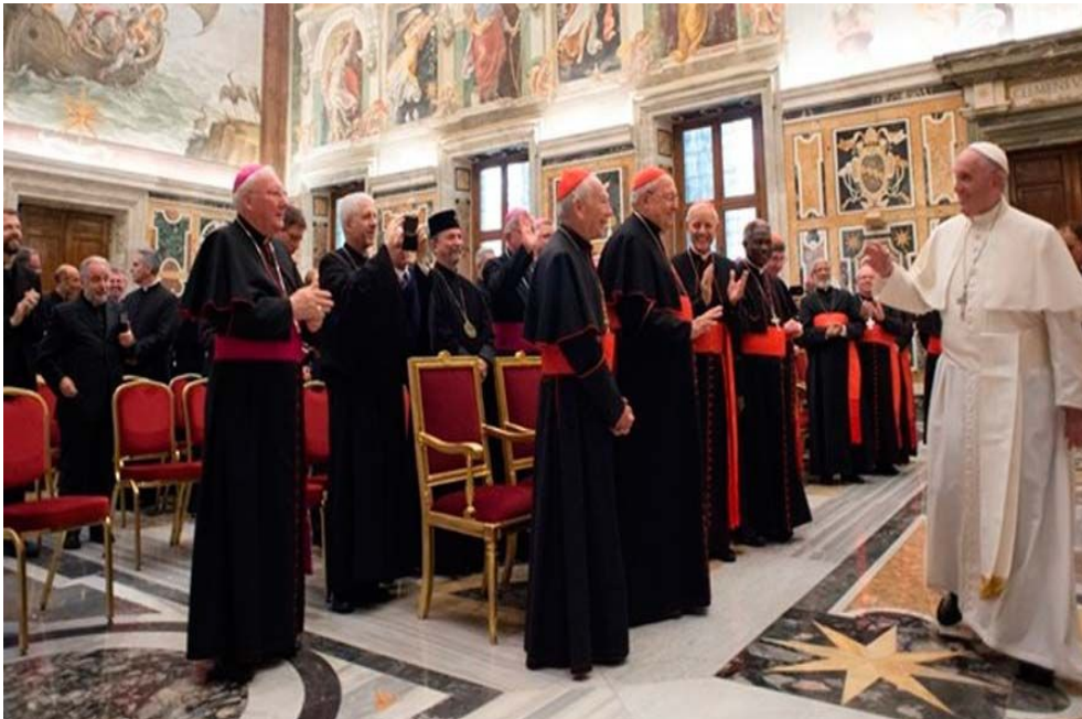
El Papa Francisco recibe a miembros del Pontificio Consejo para la Promoción de la Unidad de los Cristianos

El Papa Francisco recibió a los participantes de la sesión plenaria del Pontificio Consejo para la Promoción de la Unidad de los Cristianos y afirmó que esta unidad deseada por Jesús “ es una de mis principales preocupaciones ”; sin embargo, recordó que “la unidad no es uniformidad”.