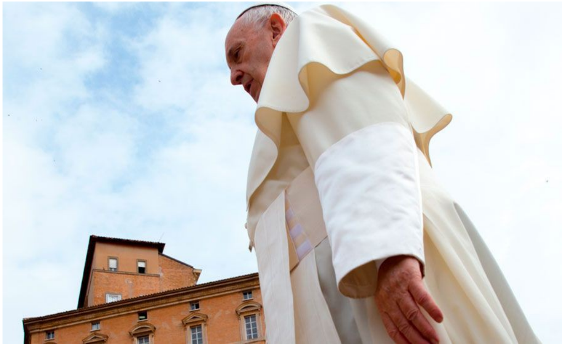
El Papa Francisco.

El Papa Francisco pidió impulsar el diálogo ecuménico entre católicos y luteranos reflexionando con precisión en temas teológicos sobre la Iglesia, la Eucaristía y el ministerio eclesial.