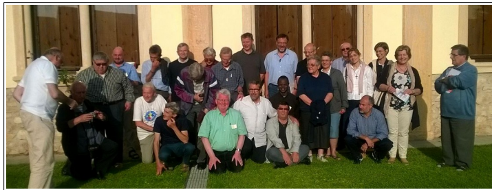
Assemblée Européenne, Verona, Italie